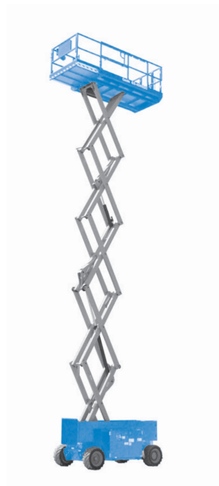
(1) Abonnement 2 ans compris